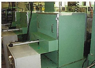
イッシー工業様(長野県立科町)