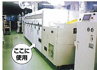
日置電機様(ハンダ装置の断熱)(長野県上田市)