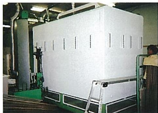
株式会社キキ様(長野県小諸市)